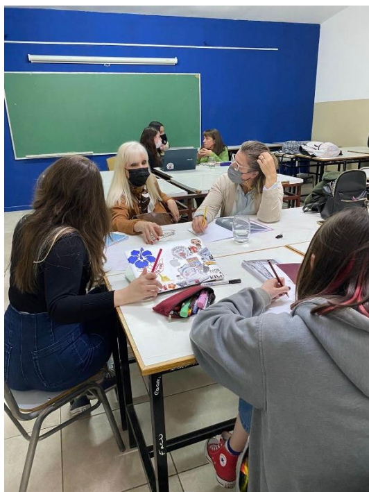
Figura 1. Alumnos y artistas trabajando de manera conjunta en el aula de la Facultad de Arquitectura y Diseño. 2022.

Son muchos los aspectos que hacen a la importancia de esta colección. Por un lado, el aporte al acervo del museo; por otro, la vinculación de los estudiantes de la carrera de DV con los artistas y el enriquecimiento de su formación general y específica en ese vínculo. Por último, pero no menos importante, la difusión de las obras artísticas en la comunidad; y puesto que la colección se centra en mostrar particularmente la obra de artistas patrimoniales platenses —con muestra permanente en el museo—, constituye un valioso aporte a la cultura de la ciudad. El resultado de este trabajo pone en relación tanto ámbitos académicos como artísticos, estableciéndose el contacto entre estudiantes y artistas para el desarrollo de cada libro.