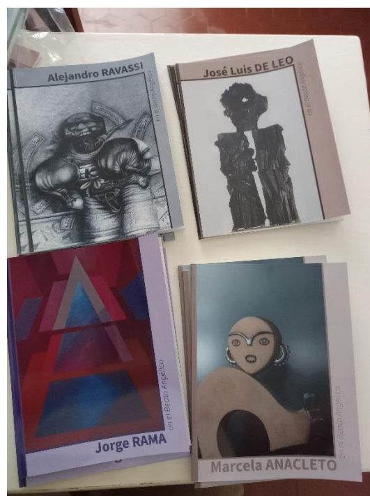
Figura 2. Tapas de ejemplares, 2.ª edición. 2023.