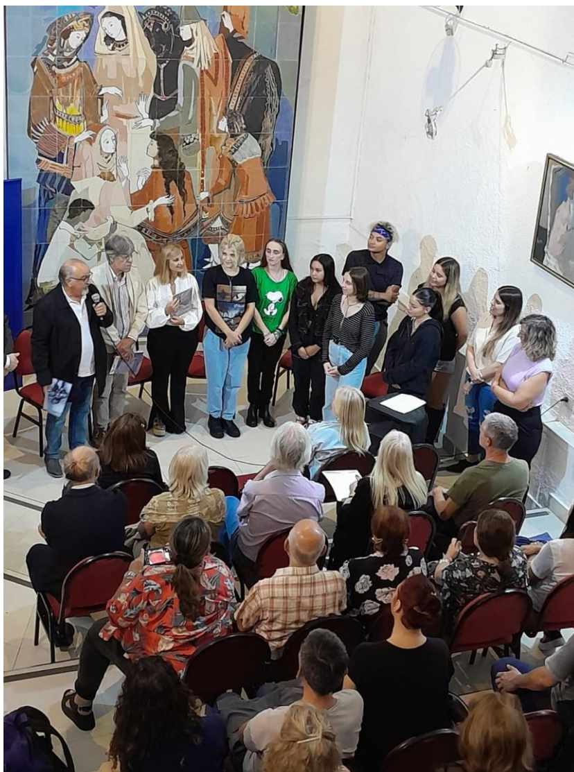
Figura 6. Presentación de libros en el Museo Beato Angélico. 2023.