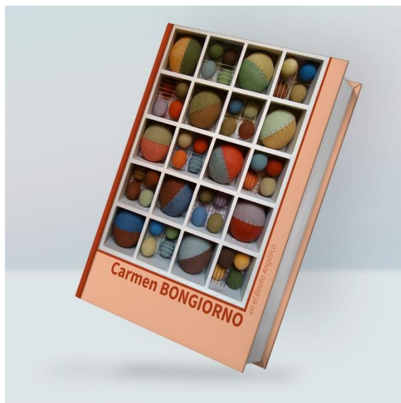
Figura 3. Tapa de libro, 2022.