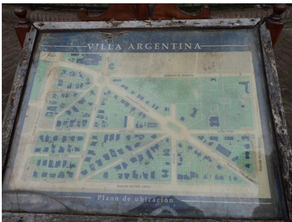
Figura 1. Plano histórico ubicado en el acceso al barrio.

En este informe se presentan los resultados del proyecto de investigación “Inventario de la primera etapa, del Barrio de la Cervecería Quilmes, Villa Argentina”, realizado en UCALP Sede Bernal en el período 2022-2023, financiado por la Universidad Católica de La Plata de acuerdo a la Resolución Rectoral 824/22.