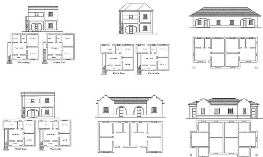
Figura 7. Plantas y alzados de las distintas tipologías originarias del barrio. De los investigadores.

El paisaje se completa por la ubicación e implantación de cada una de las viviendas y el equilibrio del espacio entre las mismas, rompiendo la monotonía e intercalando tipologías diferentes que se desarrollan en uno y dos niveles, sin superar los 10 m de altura, dependiendo del tipo de cubierta.