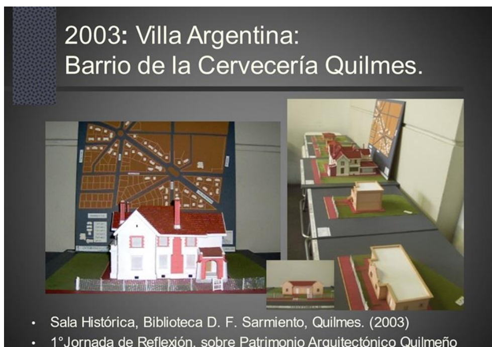
Figura 4. Exposición modelos de tipos de vivienda del barrio escala 1:50. Catedra H2 FAD UCALP.