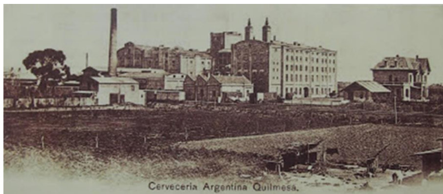
Figura 2. Cervecería Quilmes a principios del siglo xx. Museo Histórico Fotográfico de Quilmes.