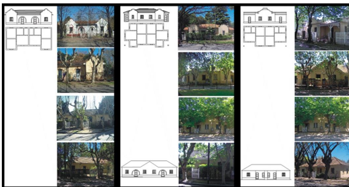
Figura 3. Clasificación tipológica de las viviendas originarias del barrio. Elaboración propia.

El método aplicado consiste en un abordaje en diversas escalas que permite reconstruir la historia local y establecer los parámetros de diseño ambiental y arquitectónico que dieron lugar a la creación del barrio. En cuanto a la escala, partiendo del territorio hasta llegar a la vivienda agrupada por tipo, con la doble lectura: planimetría catastral versus recorrido perceptual. En síntesis, se propone una aproximación multidimensional que incorpora el medio ambiente y el hombre concreto que habita una particular propuesta de arquitectura, en una época histórica precisa. De esta forma, se obtiene un inventario del total y cada una de sus partes.