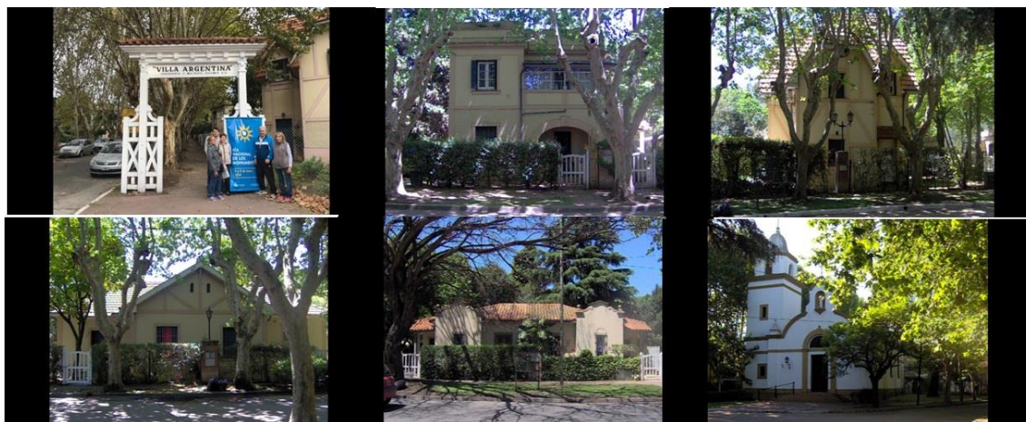
Figura 5. Relevamiento perceptual: Recorriendo el barrio cámara en mano.

La empresa adquiere un predio de 105.000 m 2 , ubicado entre la planta fabril y el parque, un lugar ideal donde construir un barrio de viviendas para los empleados y obreros de la cervecería. Se cumple finalmente el sueño de la familia Bemberg, con la inauguración en 1925 de la primera etapa de un ideal “Villa Argentina”.