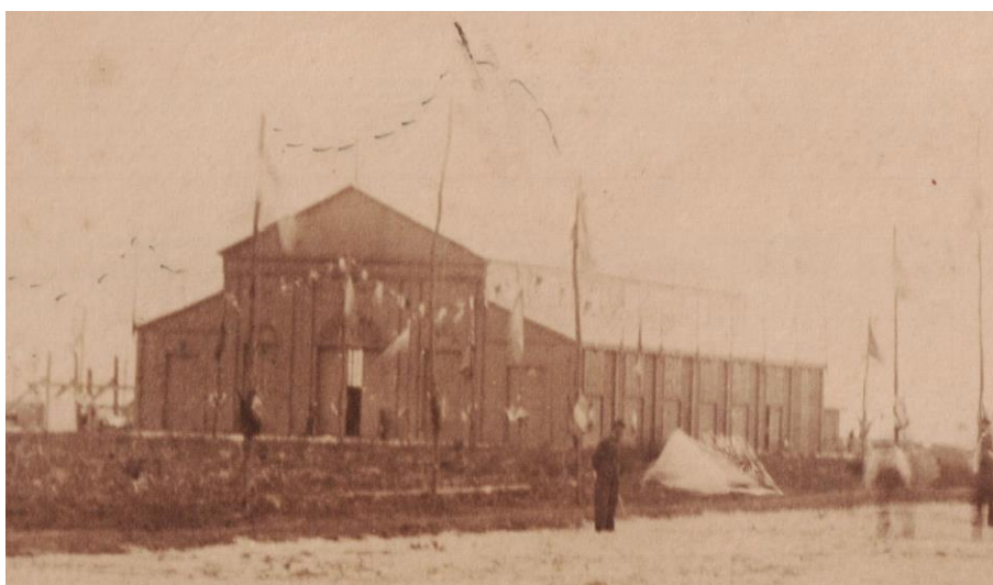
Figura 6. Bradley, T. (1885). Pabellón Argentino en donde se realizó el banquete de fundación de La Plata [fotografía]. Buenos Aires: Vistas de La Plata y obras del puerto , agosto de 1885.

Plata que contó con ese adelanto. Luego del banquete del 19 de noviembre de 1882, se estableció allí la oficina de delineación a cargo del ingeniero Joaquín V. Maqueda, fue sede provisoria del Departamento de Ingenieros, y se usó también de manera transitoria para el servicio de misas dominicales. En 1884 el empresario teatral Manuel Ballesteros lo arrendó para ofrecer espectáculos a la población, tomando el nombre de "Teatro Argentino", siendo el primer teatro que funcionó en La Plata (Salvadores, 1932, p. CII). En 1887 fue cedido al naciente Club de Gimnasia y Esgrima, el cual estableció allí su sede social (De Paula, 1987, p. 95). Algunos consideran que el edificio fue desmontado y trasladado al Paseo del Bosque cuando se construyó allí el estadio en 1923 (Bionda, 1944, p. 188), pero esto no ha podido ser comprobado, por lo que su destino final es incierto.