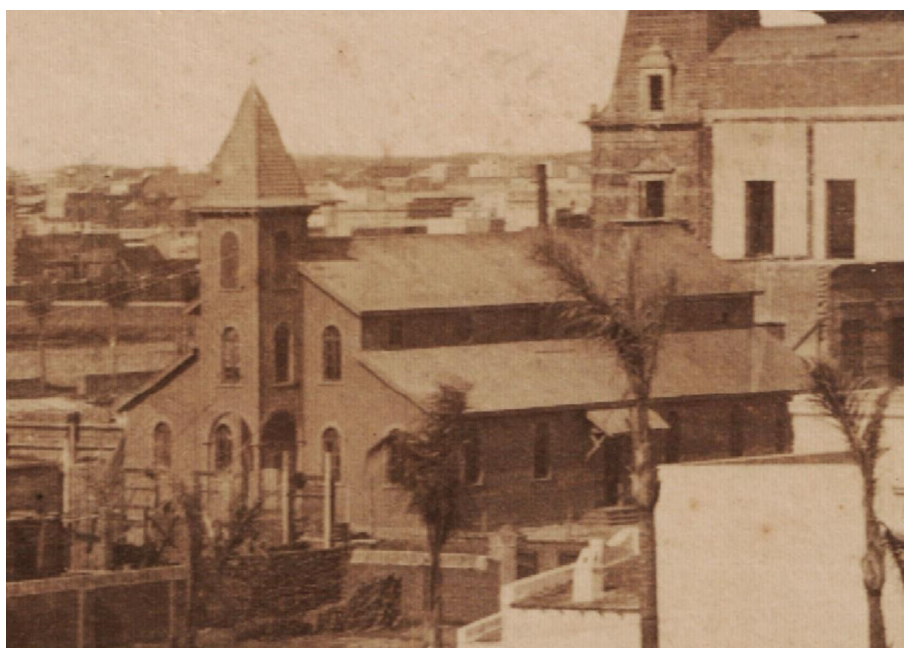
Figura 4. Bradley, T. (1885). Iglesia usada para usina eléctrica en calle 5 entre 51 y 53 [fotografía]. Buenos Aires: Vistas de La Plata y obras del puerto, agosto de 1885.

A propósito: ¡si vieseis cuán gracioso es el edificio reservado para la producción de la corriente eléctrica! Tiene el aspecto de una esbelta y ligera cabaña suiza pero de proporciones colosales y en su interior están alojados potentísimos motores que levantan un ruido endiablado. Visto de noche, aquel edificio, con todas las ventanas iluminadas, el vértice de la chimenea empenachado de humo, mientras las máquinas crujen y jadean como la respiración de un gigante, se diría que aquello es la habitación de alguna bruja o más bien el lugar de reunión de un escuadrón de nigromantes. (Barcia, 1982, p. 55).