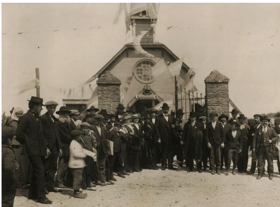
Figura 2. Autor desconocido (1914). Inauguración de la capilla de los Sagrados Corazones en 31 y 46 [fotografía]. La Plata: Archivo histórico del Sagrado Corazón.

En agosto de 1884 comenzó el armado de uno de los templos de madera en un terreno que ocupaba media manzana sobre calle 57 entre 8 y 9 (Borrazas y Maggi, 2009, p. 177), el cual