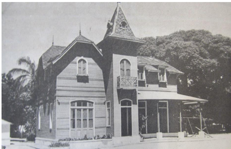
Figura 8. Autor desconocido. (1994). Chalet para la Dirección de Paseos y Jardines en el Parque Saavedra [fotografía]. La Plata: Diario El Día .