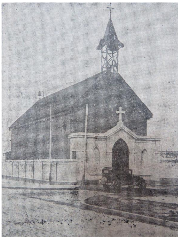
Figura 5. Autor desconocido. (1931). Iglesia de San Antonio de Padua [fotografía]. La Plata: Diario El Argentino .

En 1916 fue inaugurado en la esquina de 39 y 118, en el Barrio Hipódromo, un nuevo templo de madera: se trató de la capilla de San Antonio de Padua ( El Argentino , 3-5-1916, p. 6). Este templo al cual se accedía por un pórtico de material, tenía 8,5 m de ancho y 25 m de largo. No se disponen de más datos salvo los planos del antiguo templo y fotos antiguas como la que se adjunta, de la cual puede sospecharse que se trataba también de uno de los templos de madera importados, que fueron emplazados en La Plata.