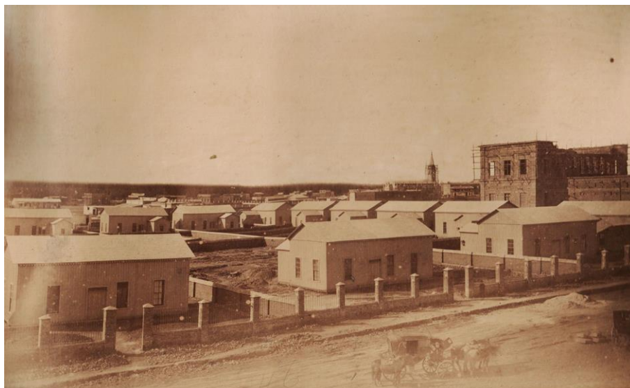
Figura 1. Bradley, T. (1885). Casillas de madera en avenida 7 entre 45 y 46 [fotografía]. Buenos Aires: Vistas de La Plata y obras del puerto, agosto 1885.

Las casas prefabricadas que el gobierno adquirió a la empresa de A. Rivolta, Carboni & Cía. llegaron al Puerto La Plata en el vapor SS Louise H. (Ministerio de Gobierno, 1884). Fueron fabricadas en Chicago por la firma Shaw Brothers y enviadas en tren hasta Nueva York, donde fueron embarcadas en cajas con destino a La Plata. Se decía que tan repentina demanda de construcciones modulares hizo surgir el rumor en los Estados Unidos de que su destino era "una isla cercana a Buenos Aires, que fue devastada por un huracán" ( El Día , 19-11-1940, p. 6).